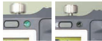
OK (緑ランプ) NG (消灯)