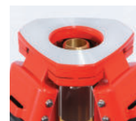
PMWS2-OT 平面脚頭定芯桿 35mm