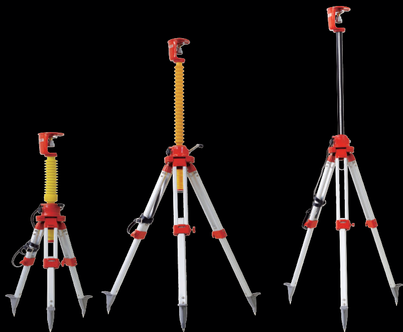
粉塵侵入防止モデル