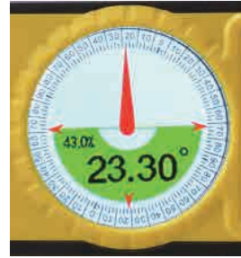
角度勾配測定モード