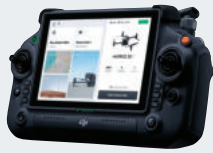
スマート送信機 DJI RC Plus 7インチの大画面。長時間駆動可能