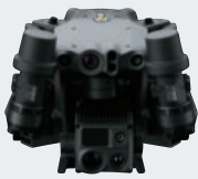
コンパクトに 折りたたみ可能